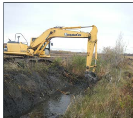
Creusage de cours d'eau