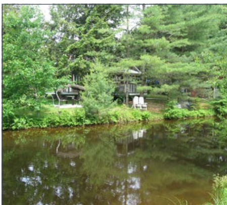
État de la bande riveraine