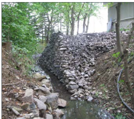
Remblai/enrochement dans la rive