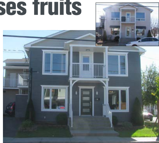
Les propriétaires du 146, rue Saint-Damase ont bénéficié du programme pour effectuer des travaux au bâtiment abritant deux locaux, l'un commercial et l'autre résidentiel. En médaillon, le bâtiment avant la réalisation du projet.