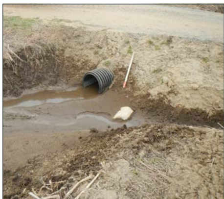
État de la traverse de cours d'eau