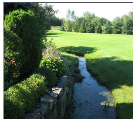
Entretien de pelouse dans la rive