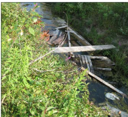
Débris dans un cours d'eau