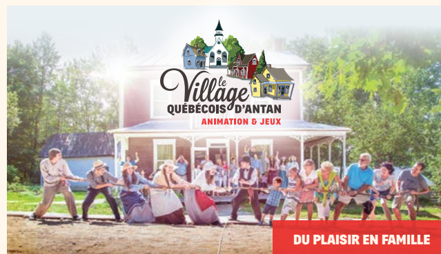
DU PLAISIR EN FAMILLE