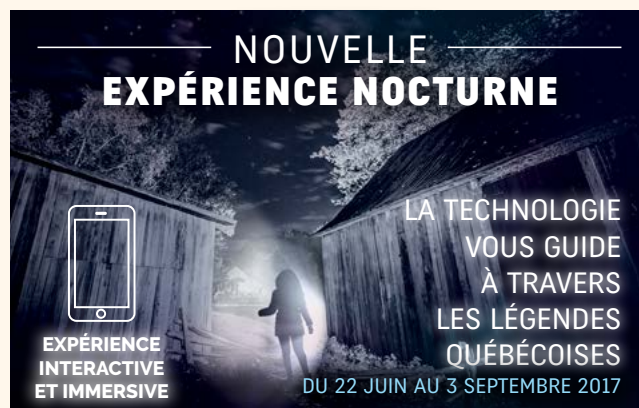
EXPÉRIENCE INTERACTIVE ET IMMERSIVE