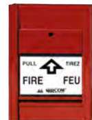
ACTIVADOR MANUAL DE ALARMA