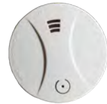
DETECTOR DE HUMO