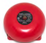
ALARMA DE INCENDIOS