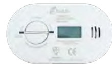
DETECTOR DE MONÓXIDO DE CARBONO (CO)