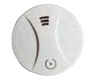
AVERTISSEUR DE FUMÉE