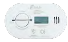
DÉTECTEUR DE MONOXYDE DE CARBONE (CO)