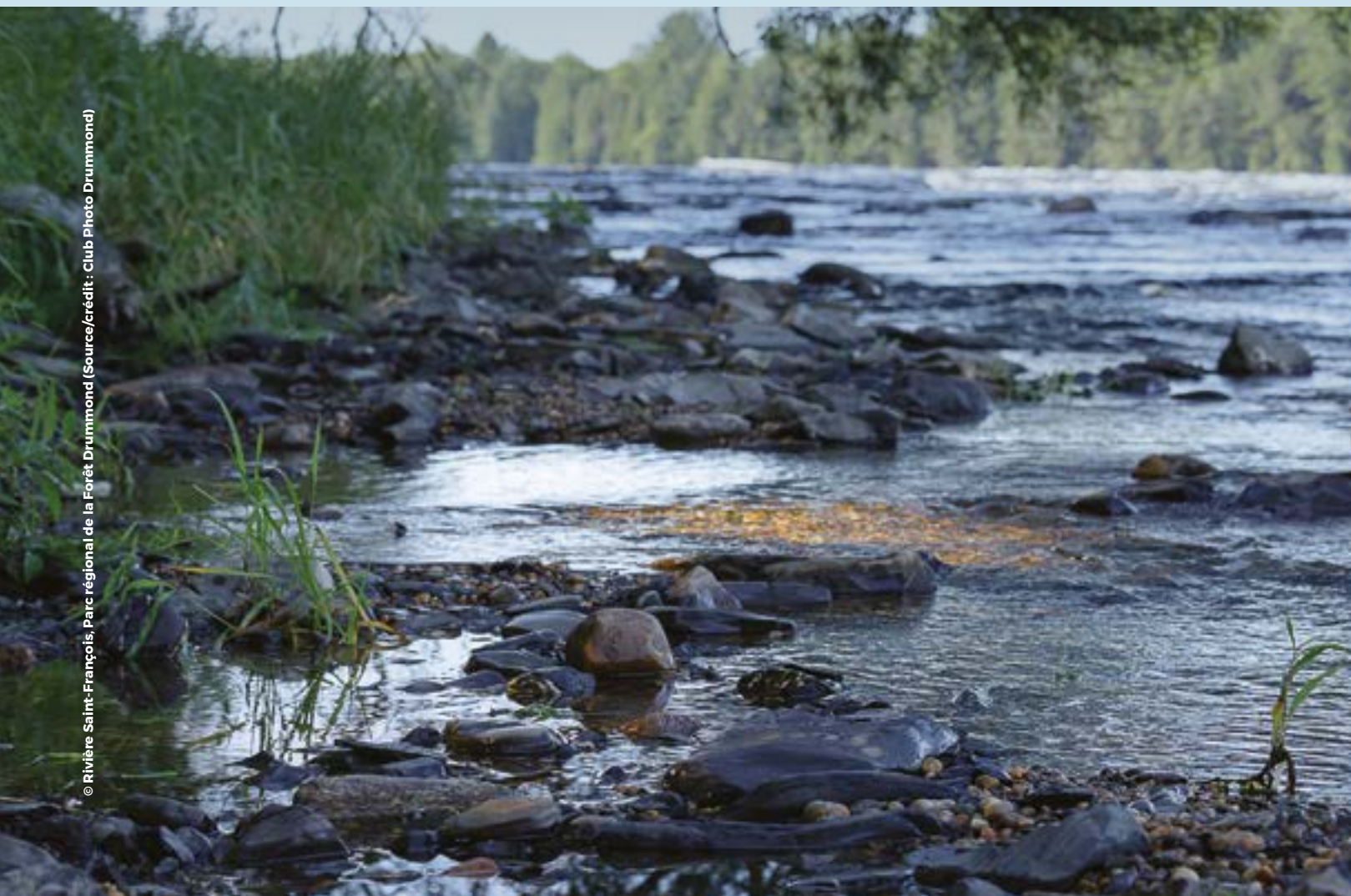
© Rivière Saint-François, Parc régional de la Forêt Drummond (Source/crédit : Club Photo Drummond)