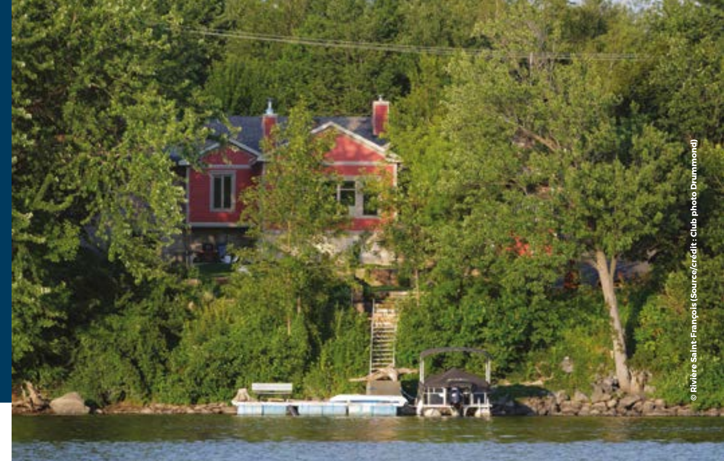
© Rivière Saint-François (Source/crédit : Club Photo Drummond)

ATTENTION : Prenez toutefois note qu'un fossé peut être considéré comme un milieu hydrique si un cours d'eau emprunte sa trajectoire.