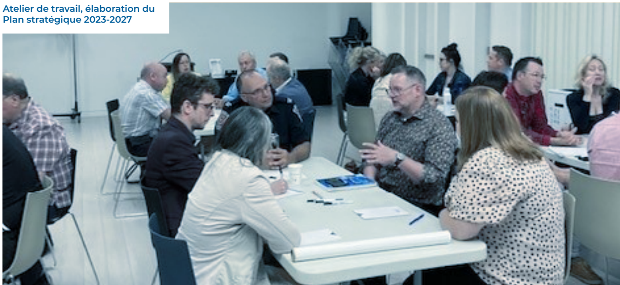
Atelier de travail, élaboration du Plan stratégique 2023-2027

Et je tiens à rappeler que si nous avons la capacité de demeurer audacieux pour notre belle ville, c'est entre autres parce que nous demeurons dans les paramètres de notre rigoureux cadre financier, bien que celui-ci reflète également l'impact de