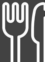
Ustensiles en plastique