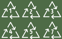
Tout objet en plastique contenant un de ces numéros