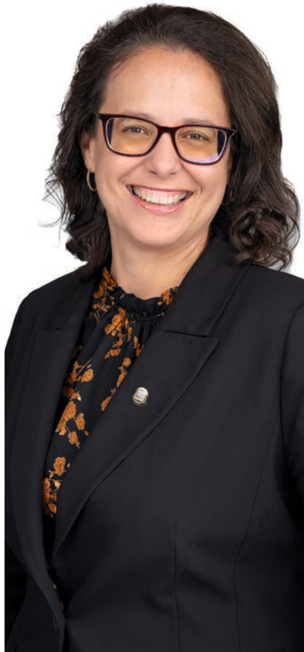
STÉPHANIE LACOSTE Mairesse de Drummondville