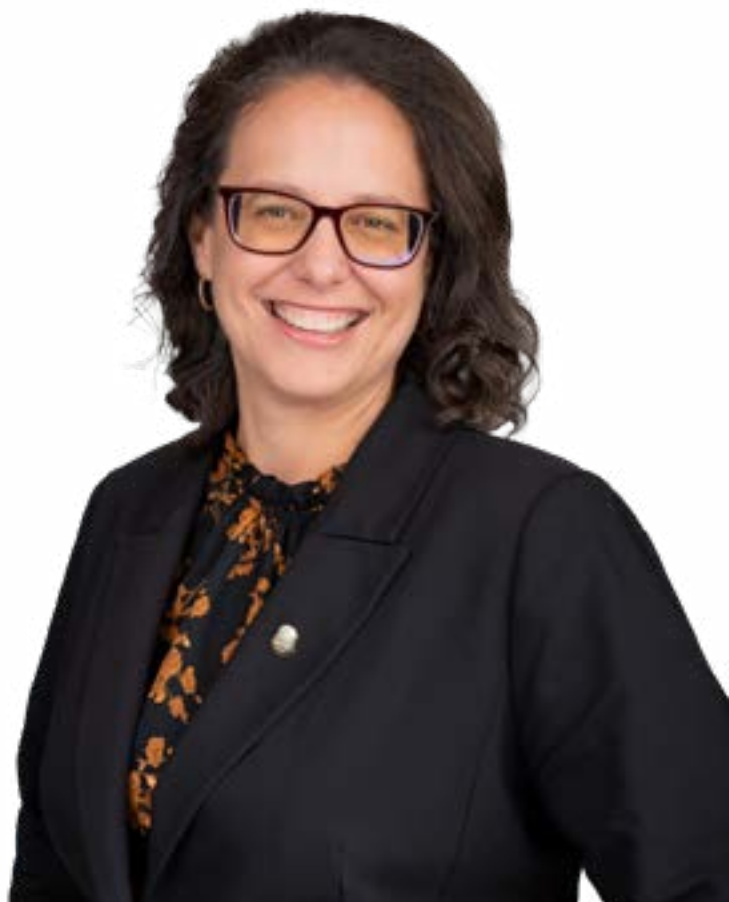
Stéphanie Lacoste , mairesse de Drummondville

« Ce budget est bien plus qu'une simple somme de chiffres : c'est l'expression de nos valeurs collectives et de notre engagement commun pour l'avenir de notre ville. »